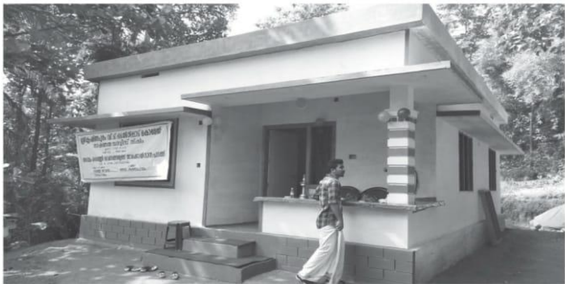
വീരമംഗലത്തെ മൈത്രി ഭവൻ