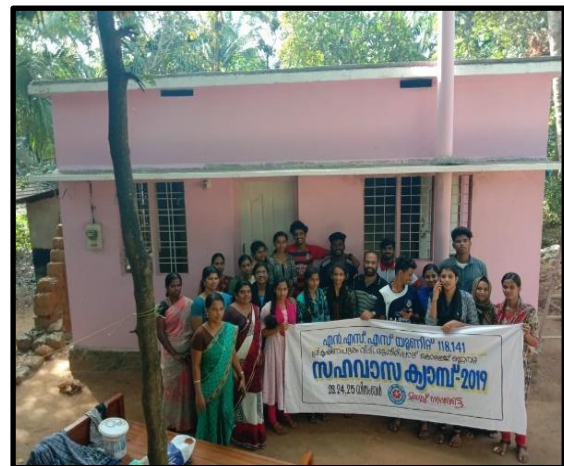
House maintenance as part of Abhayam Project